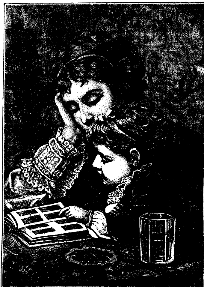
Dar acesta cine-i?