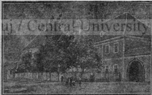
Vechea mănăstire de călugărași dela Blaj.

Scrisoarea a fost primită la Blaj în 2 Iunie 1868. Pentru copie răpunde Prof. A. Lupescu, bibliotecarul Bibliotecii Centrale Arhidiecezane.