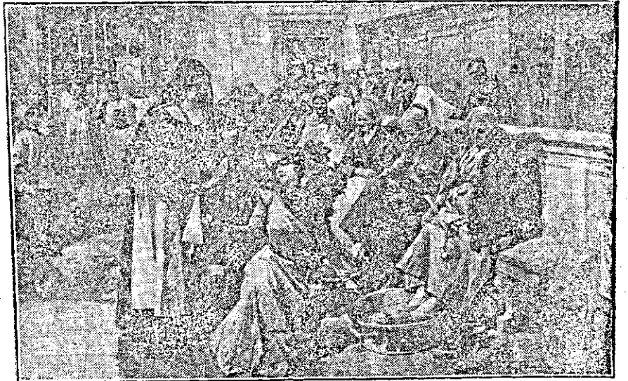
Femeile cele mai bogate din Roma în Joia mare spală picioarele femeilor sărace.

La sfârșitul acestui psalm se produce în biserică un mic zgomot, ca să însemneze cutremurul de pământ; iar clericul acela ia lumânarea de sub altar și o pune iar în sfeșnic, ca să însemneze că deși corpul Domnului e mort, lumina lui sau învățătura lui n'a murit, ci că va trăi până la sfârșitul veacurilor în Sfânta Biserică Catholică.