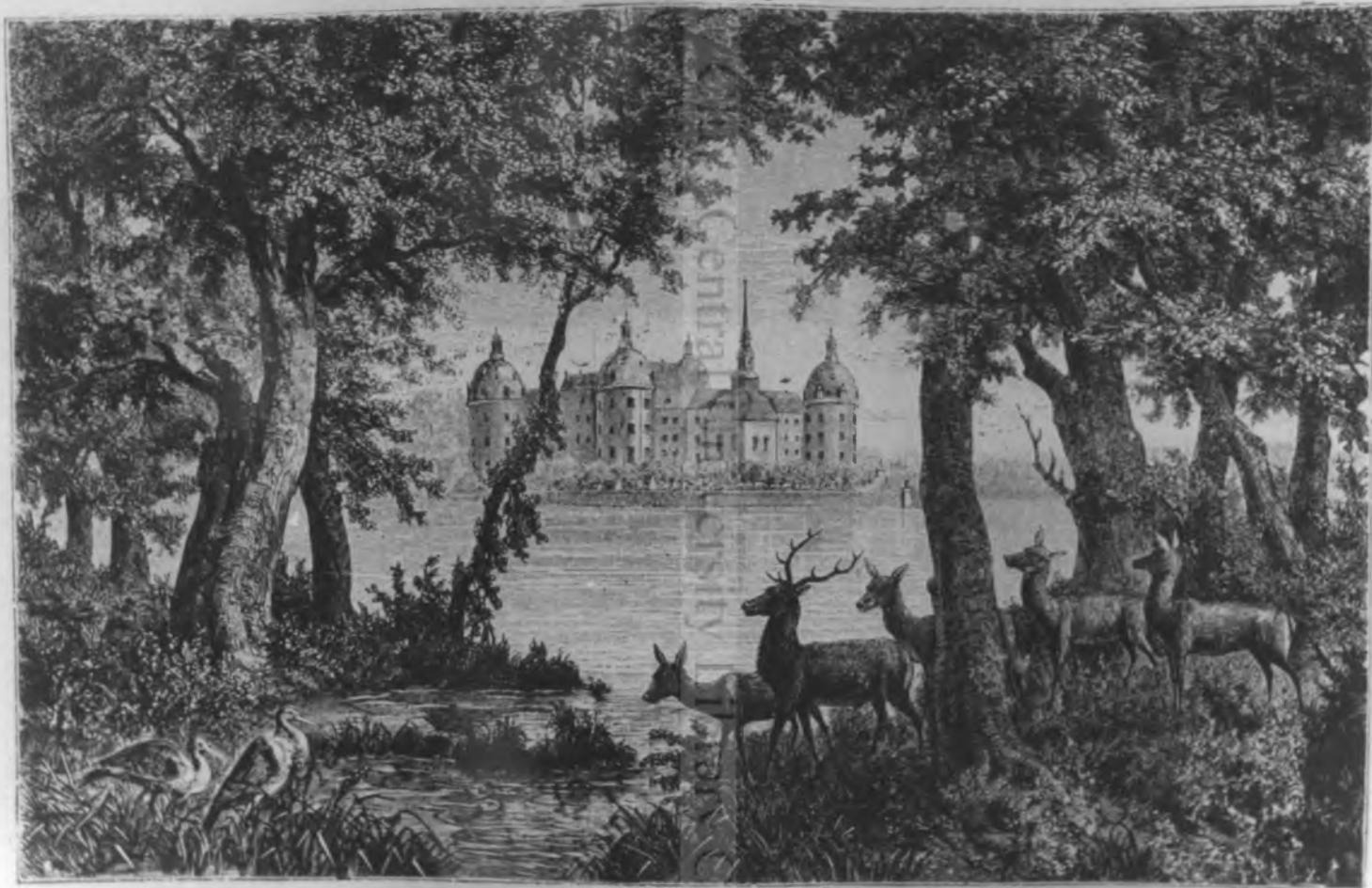
Castelul vânătoresc Jela Morizburg.