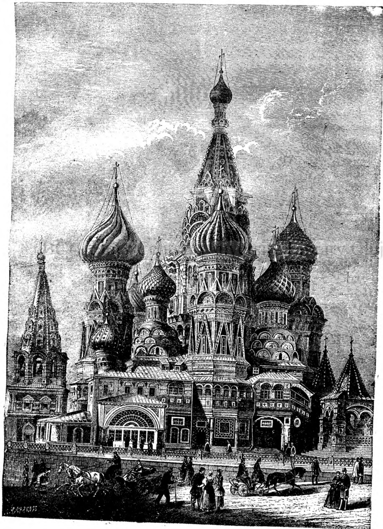
Catedrala St. Vasilie in Moseva.