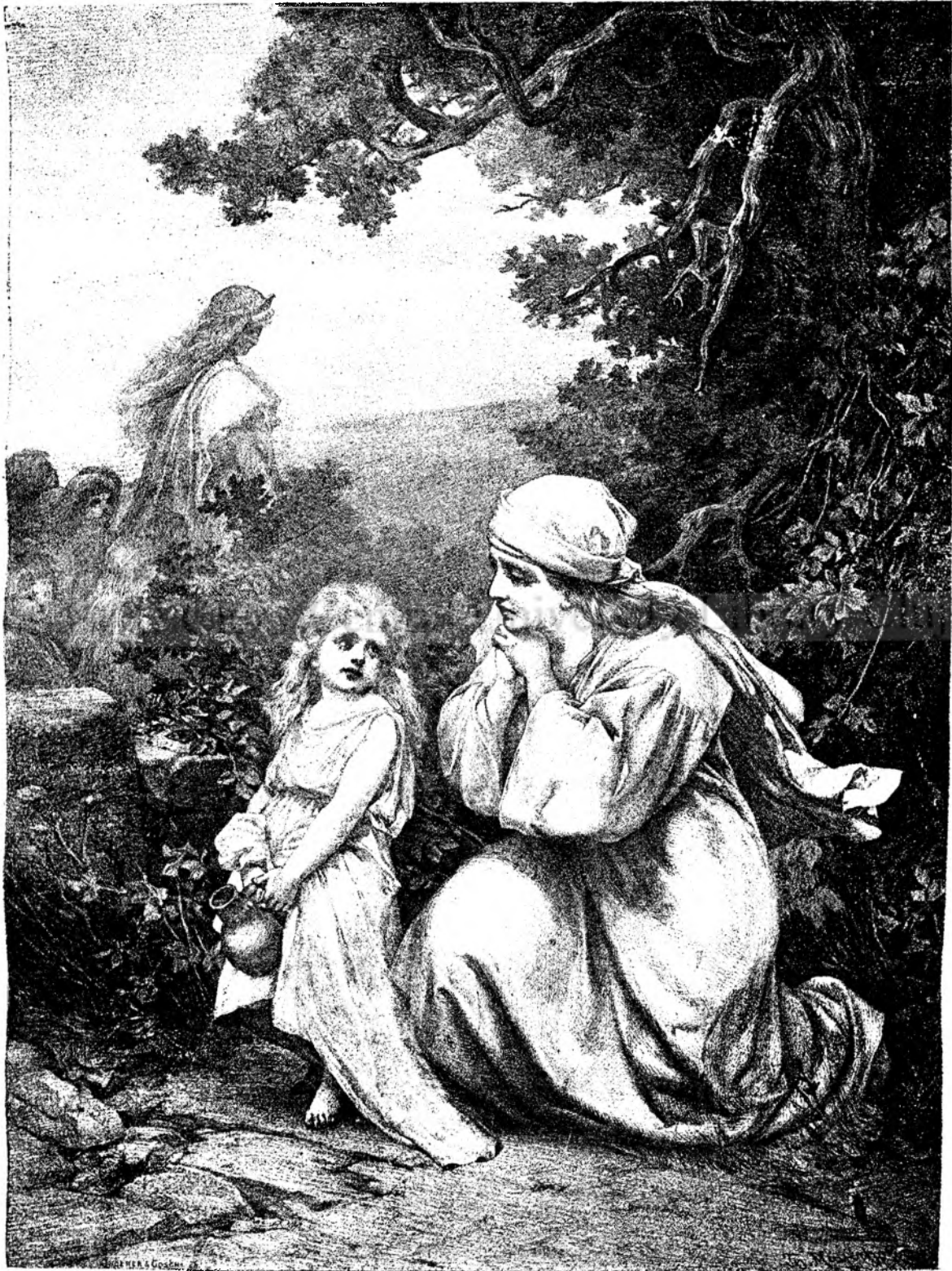
Nu plânge, mamă dulce!