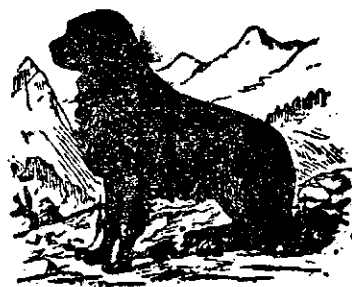
La „Cănele negru“.