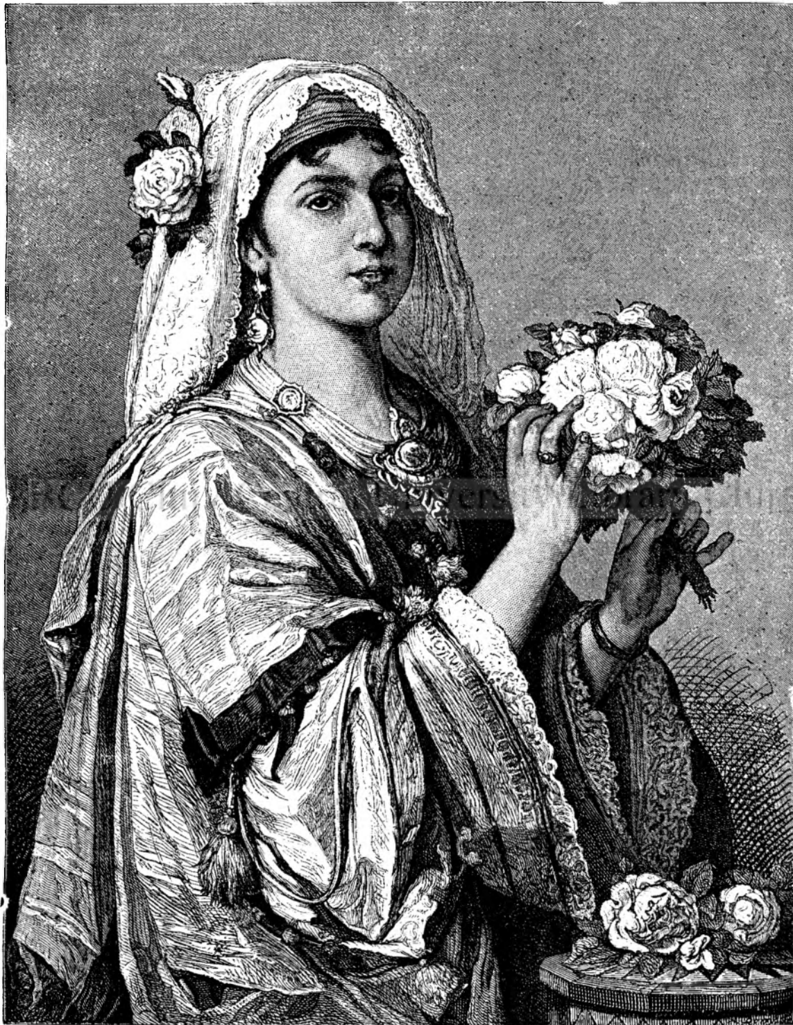
O frumsețe mauresă.

Punem dară întrebarea : S'eu latinisăm ori ba? s'eu : Putem noi s'eu nu latinisăm? spre a ne uită un moment