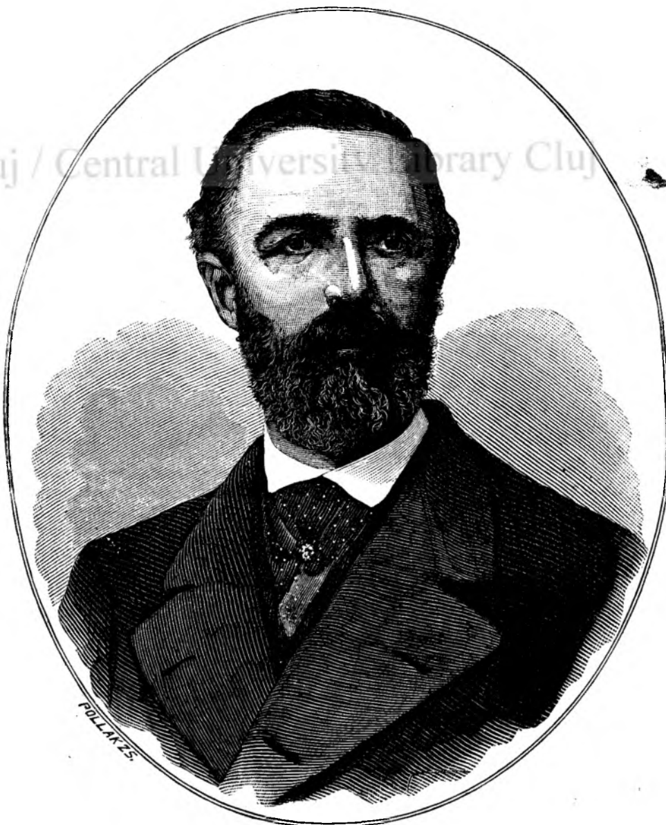
Oscar II, regele Suediei și Norvegiei.

pe tron, n'a mai publicat nimica. Cel puțin nu sub numele său. Căci, precum a dis, grigile serioase ale domnitorului numai puțin timp lasă pentru fantasii poetice.