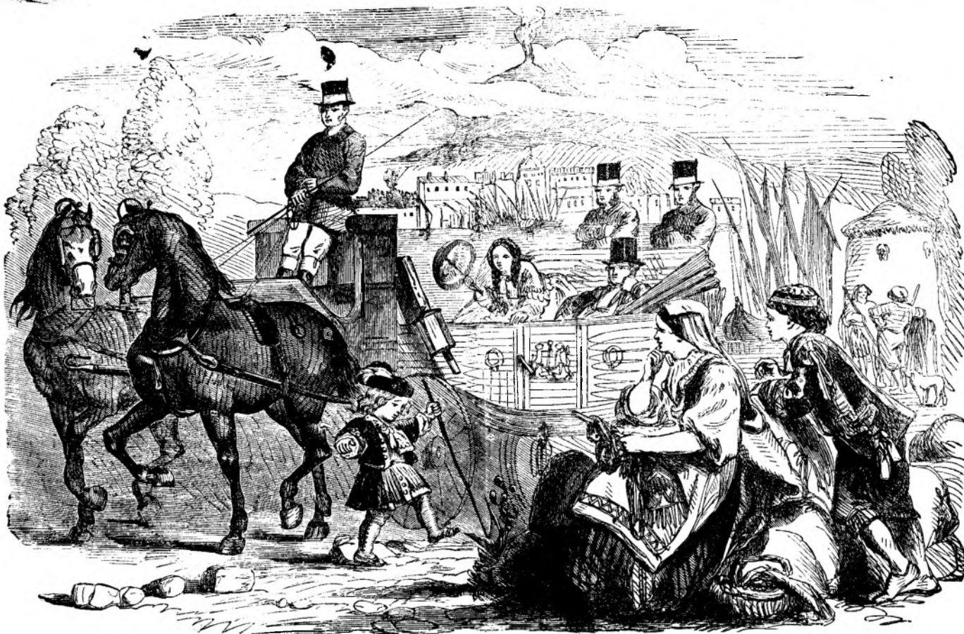
Trasur'a de gata trecu pe lângu unu colțiu de strada, când Barbu zarí pe Almadina.

BCU Cluj / Central University Library Cluj