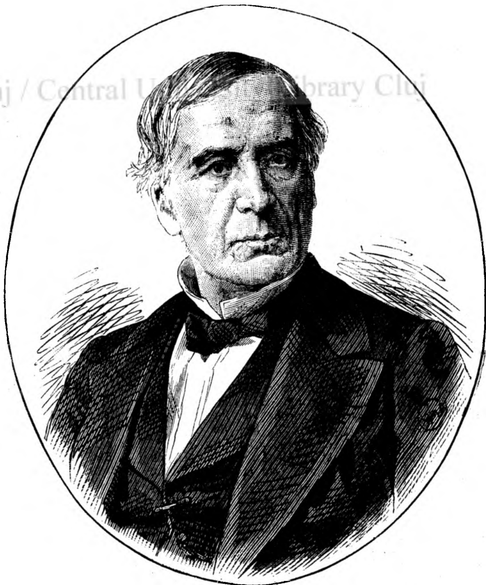
Barthélemy de Saint-Hilaire.