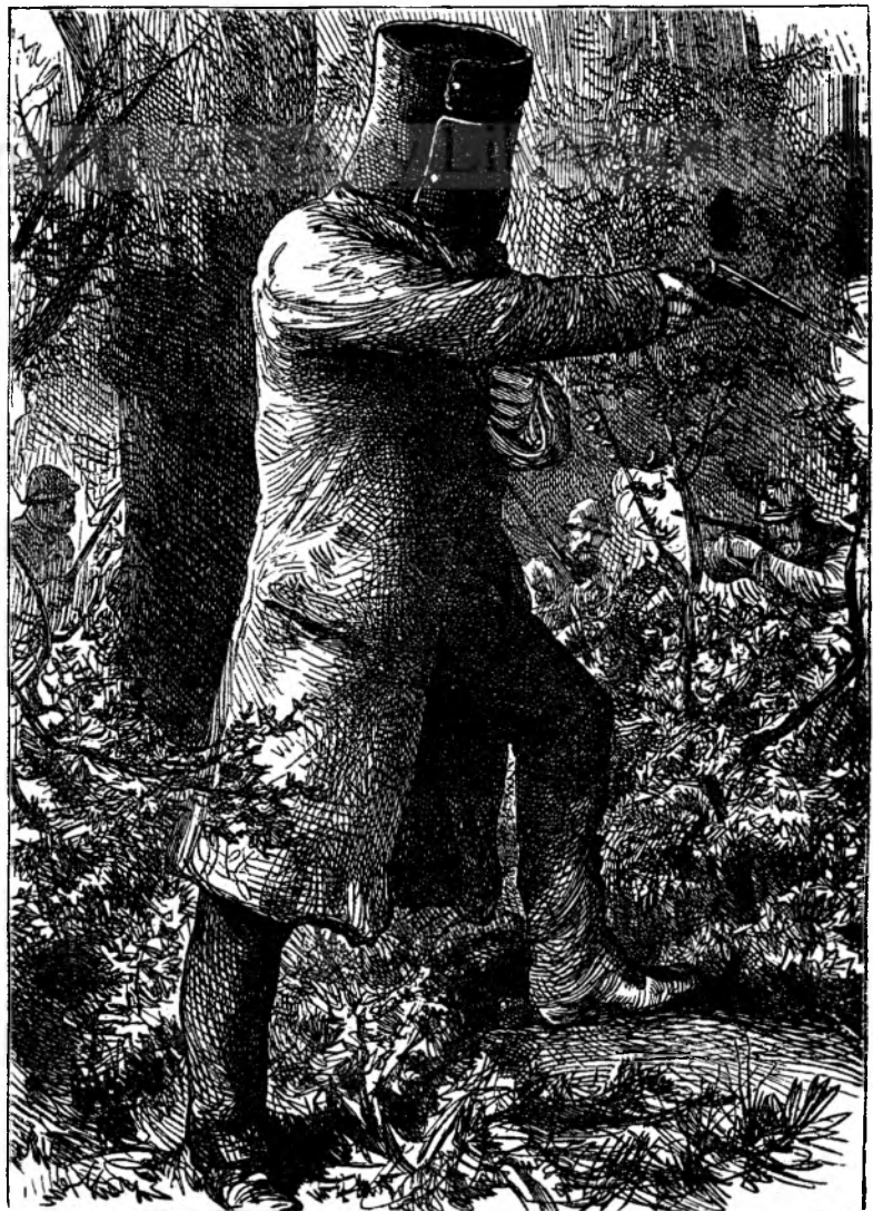
Kelly, capitanu de banditi în Australia.

Dar la noi se vede, că pentru acestu scopu, pentru această școlă, considerându starea noastră ticalósa, seraci'a și împilarea, în care ne aflăm, mijlôcele ne-