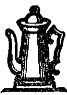
Marca de Fabrică.

la cafeaua neagră cu 4 linguri cafea din bobe — 1 lingură cafea Franck.