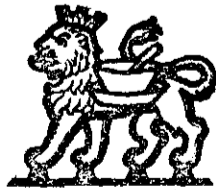
Marca de Fabrică.