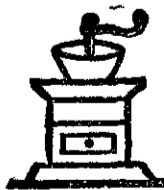
Marca de Fabrică.

Heinrich Franck Söhne Linz. Ludwigsburg.