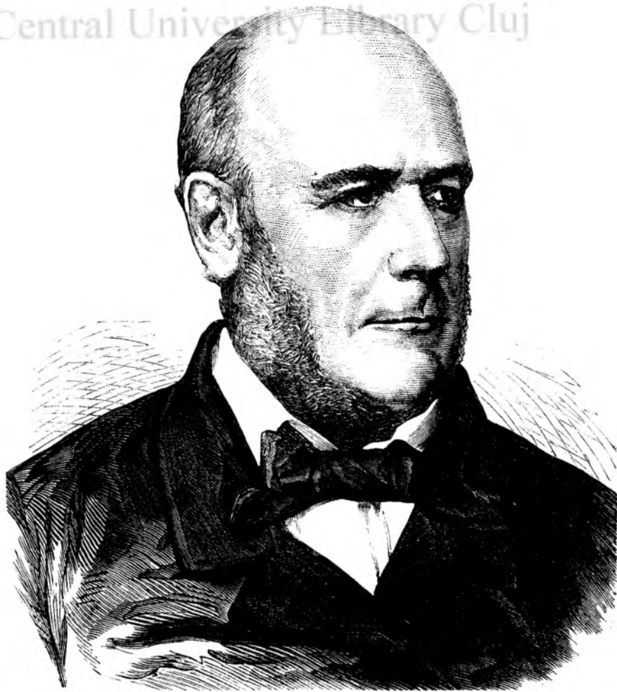
Grévy, noul șiedinte al republicei franceze.

Smaranda : Vreu să stai acasa . . . Șeu mai bine vreu să te duci să cauti în tôte partile pe Nero, și să mi-l aduci negreșitu.