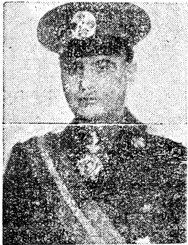
D. Ghelmegeanu, ministrul de Interne

Dat fiind că sunt mulți supoși sau vizitatori străini cari prin activitatea lor dăunează intereselor țării, în baza acestui decret-lege ministrul de interne este autorizat să dispună internarea acestor streini — până când vor fi expluzați din țară — la Mercurea-Ciucului unde s'a înființat primul lagăr pentru streini.