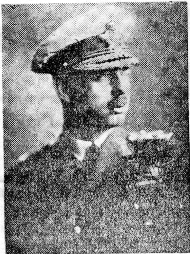
Regele Carol II. consolidatorul României moderne

În ziua de 13 August anul acesta, în sala tronului din Palatul Regal cu o deosebită solemnitate, M. S. Regele a promul-