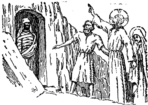
Învierea lui Lazar

păcatului roade la inimă și hordina și liniștea fug și pier din preajma păcătoșului. Iară dreptul cel curat cu inima trece senin și fericit prin lumea aceasta bine știind că numai cei drepecți, numai cei curați cu inima se vor chema fiii lui Dumnezeu și vor vedea împărăția lui.