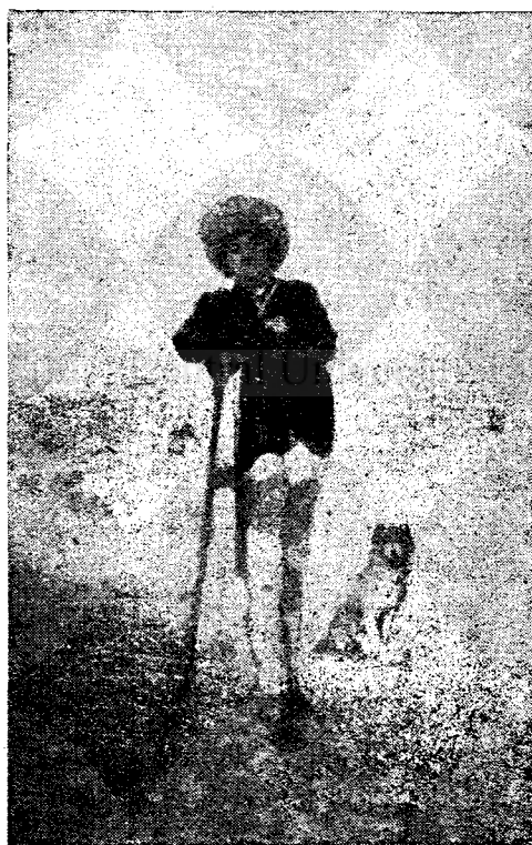
„Ciobănașul” pictură de N. Grigorescu

Respectând credința altuia, folo- sești credinței tale proprii.