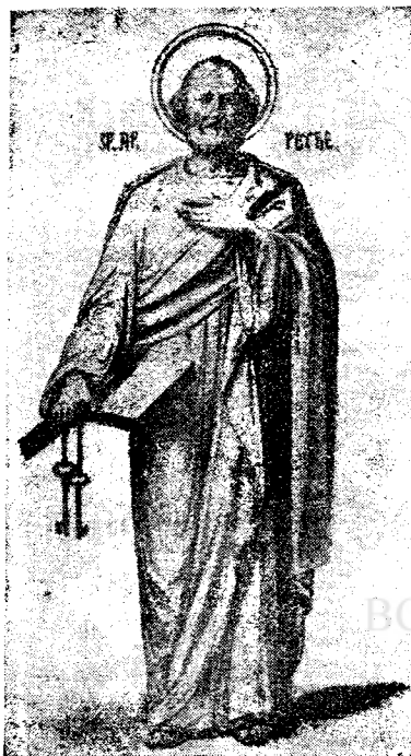
Sf. Apostol Petru