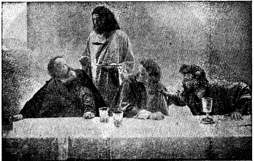
Iisus vestește trădarea lui Iuda „Fiul pierzării“

Precum un tată bun, care viața și-o pune pentru fiii lui,