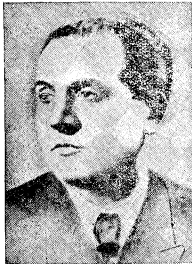
Dl Prof. Stanciu Stoian, Ministrul Cultelor

Pacea adevărată nu se poate concepe decât pe linia pe care o practică socialismul. Și pacea aceasta este pacea pentru care trebuie să lupte și Biserica. În lupta aceasta pentru pace, pe plan intern, pentru construirea