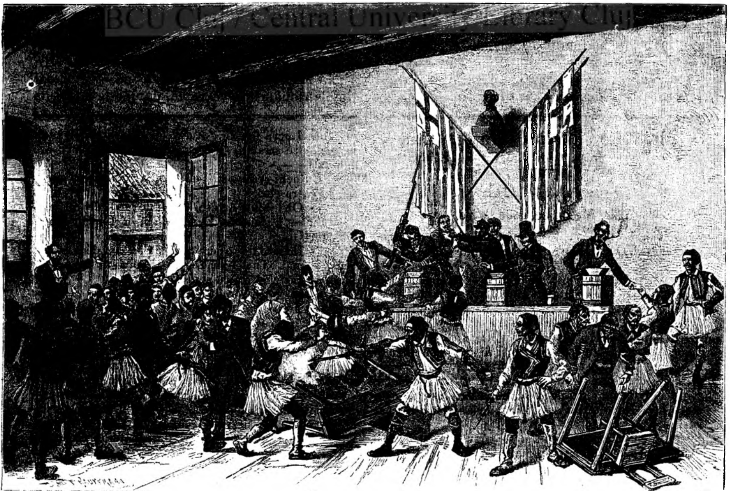
Alegere de deputatu in Grecia.