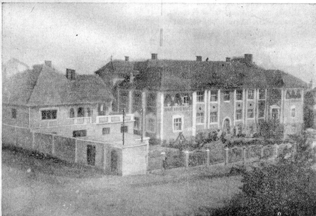
Spitalul din Reghin, dăruit Eparhiei noastre.