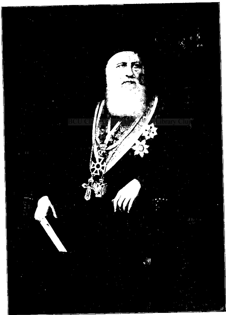
Arhiepiscopul și Mitropolitul Andreiu Șaguna.