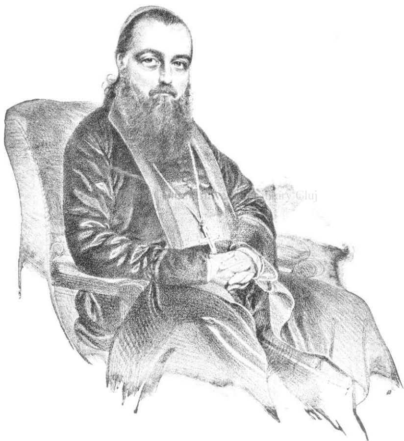
Andreiu Șaguna ca vicar-general în 1846.