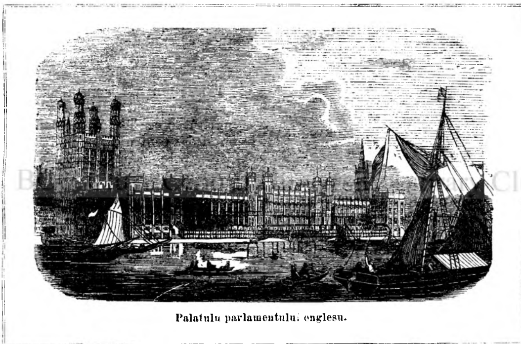
Palatulu parlamentului englesu.