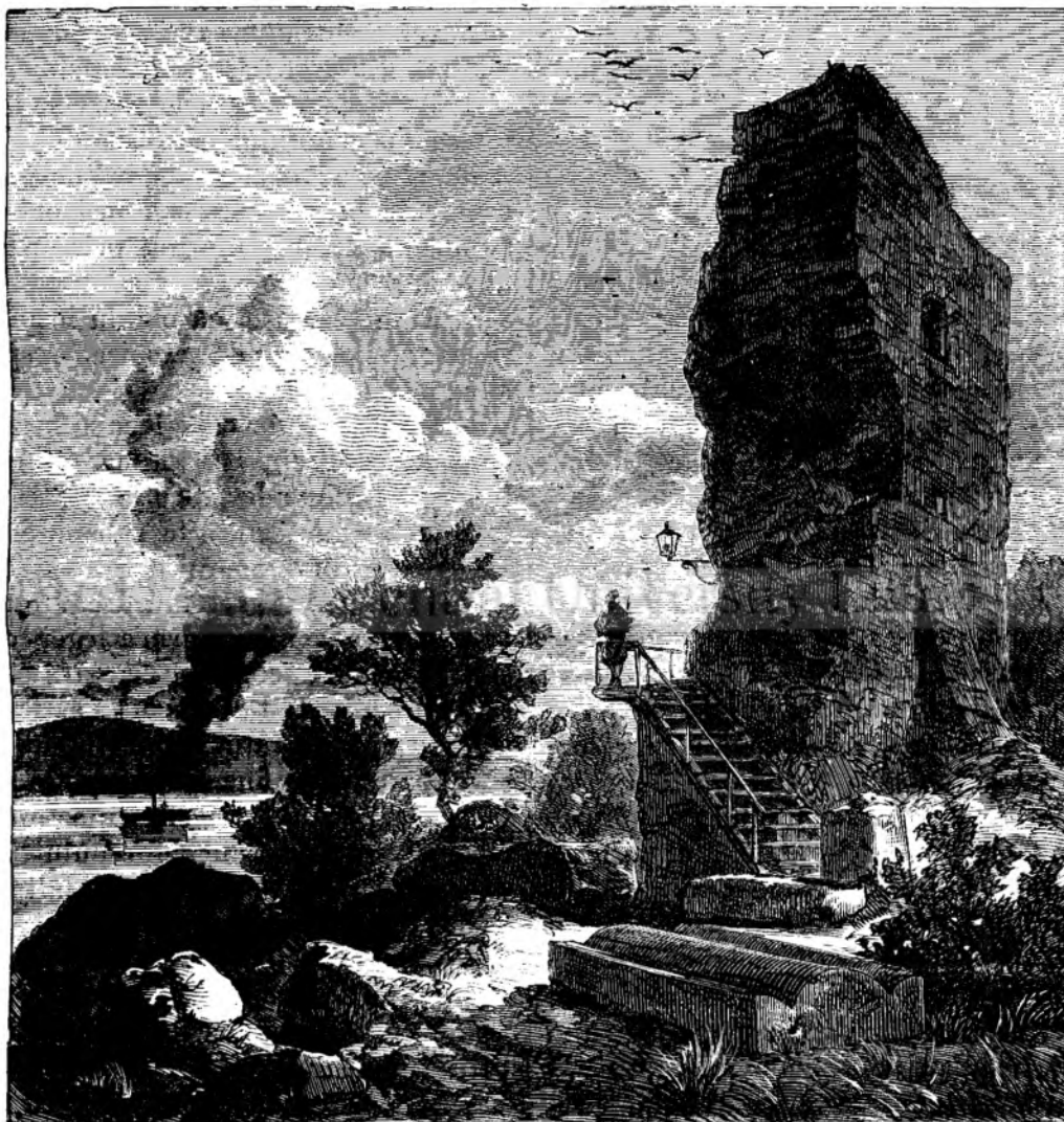
Turnu romanu la Turnu-Severianu.

Ah! vino, vino, pana e nópte: Ardiendu te-acceptu,