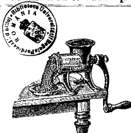
Forma SS, U, T.