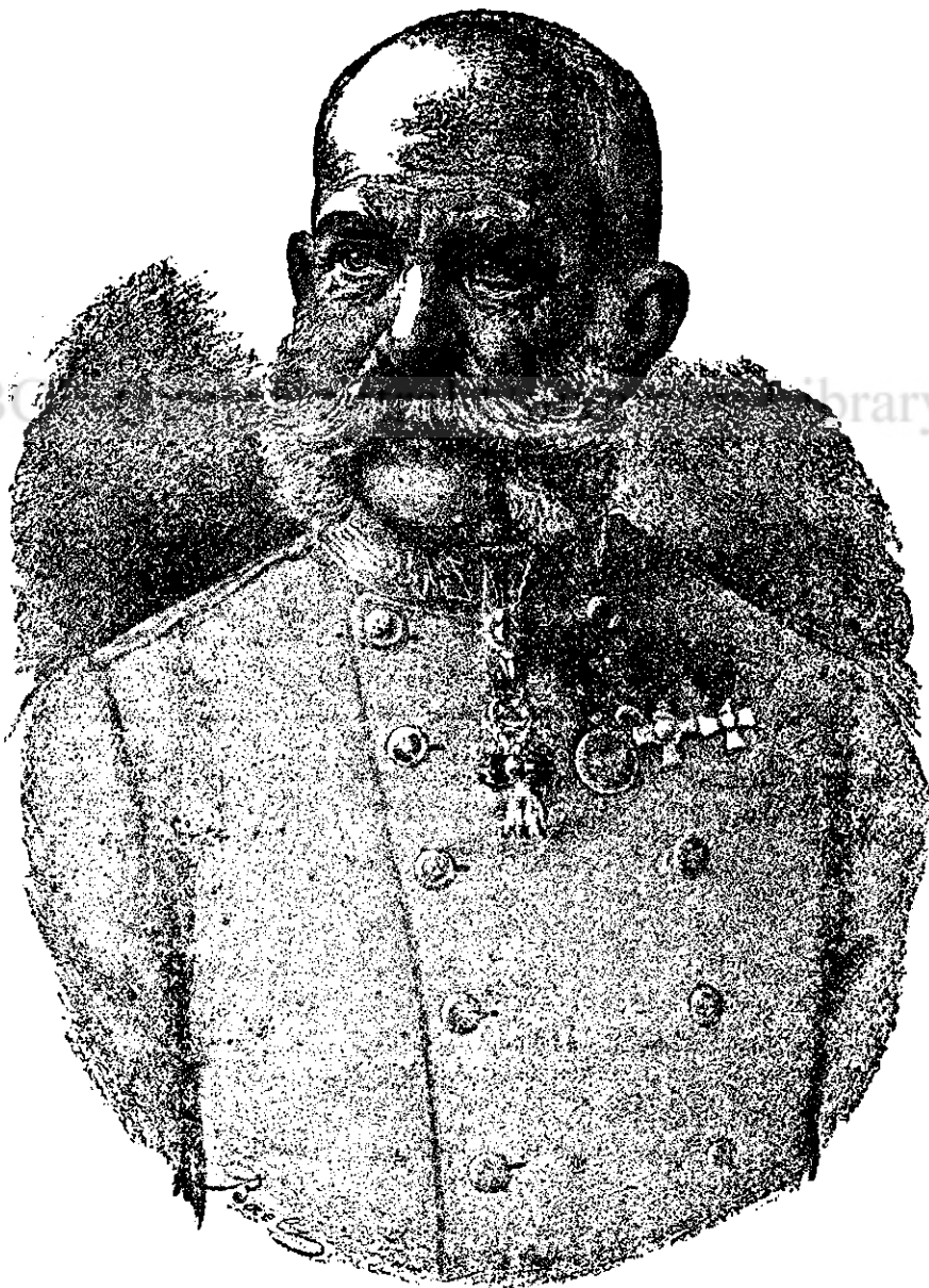
Împăratul și Regele Francisc Iosif I.

»În toastul seu (dl Désy ) a accentuat, că pe lângă limba sa maternă cea mai plăcută îi e limba română , pe carea o vorbește, deși, cu regret o constată aceasta, literatura ei nu o cunoaște. În mijlocul poporului român și-a petrecut și-și petrece activitatea etății de bărbat și a învățat să stimeze perseverența , modul de cugetare uman și sentimentele umane ale poporului român . E cel mai mare și cel mai adict amic al buneii înțelegeri fră-