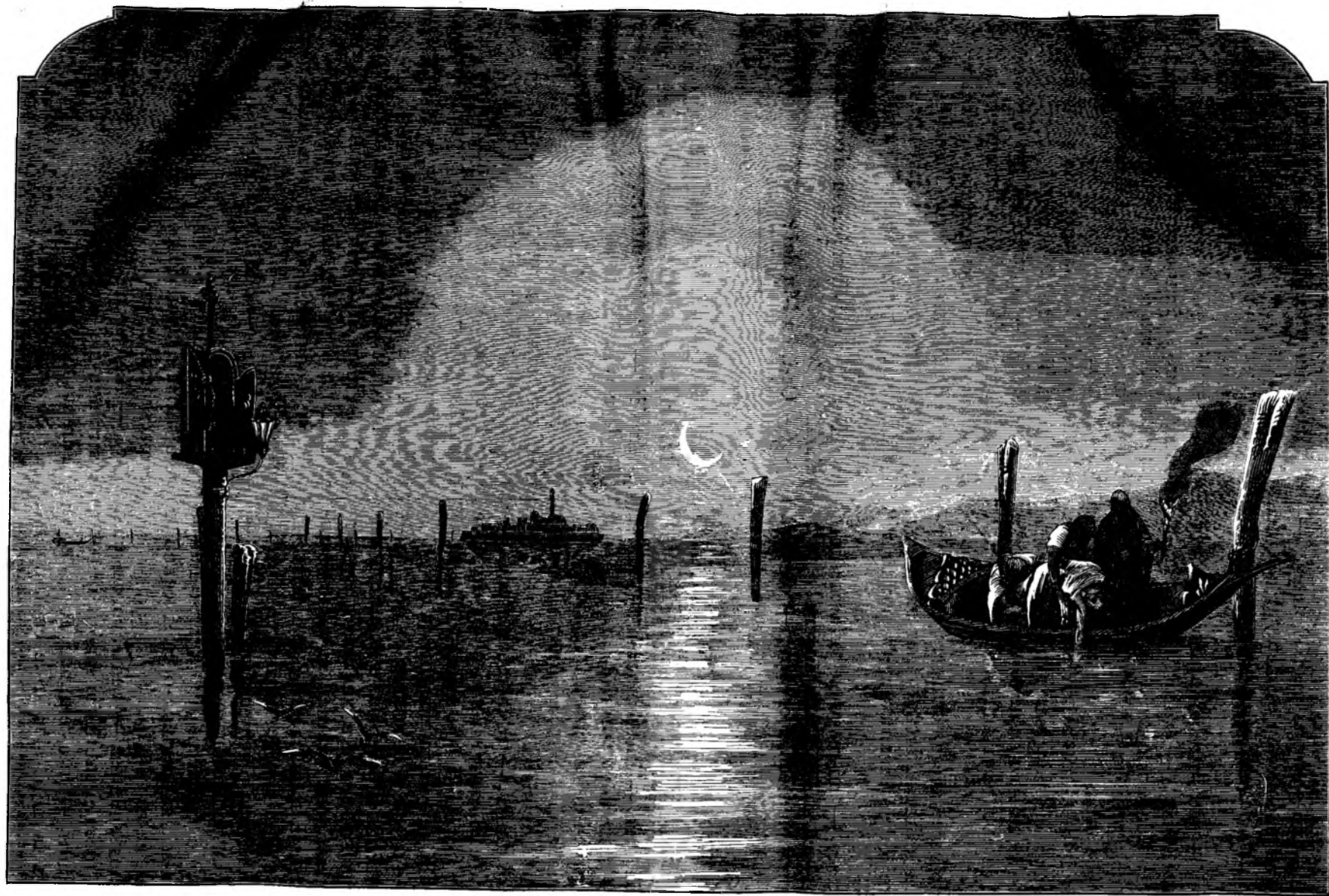
Inmormentare in Veneti'a.