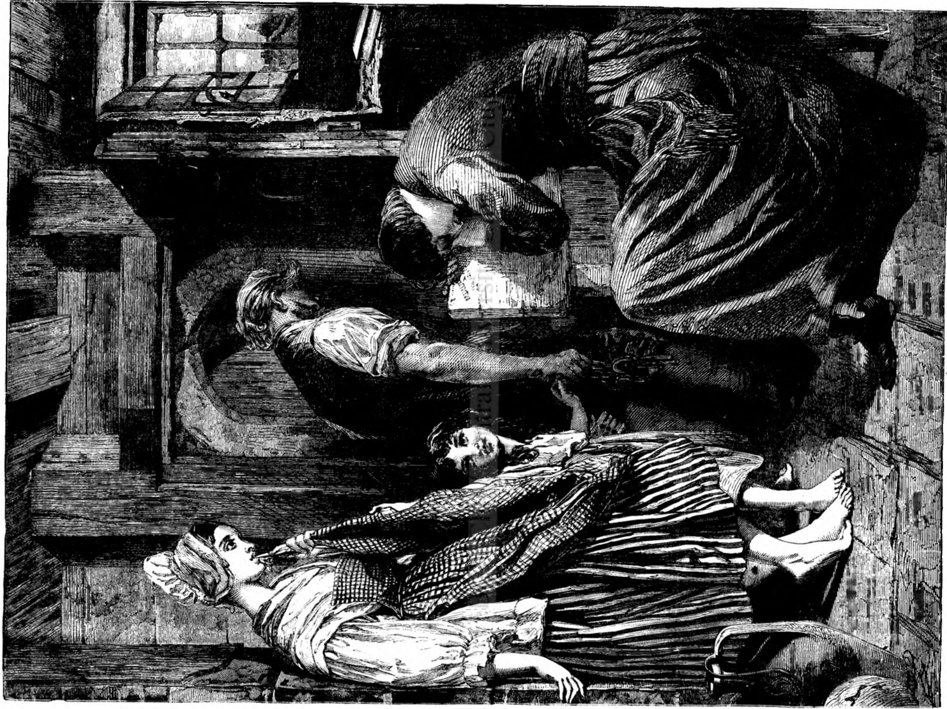
O scenadin inchisóre.