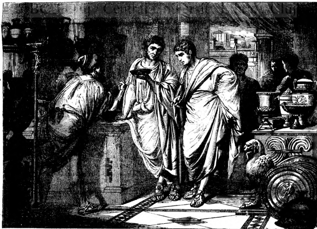
Negutiatiori antici din Roma.

Pretiuu pe anu 10 fl., pentru Roman'fa 2 galbeni.