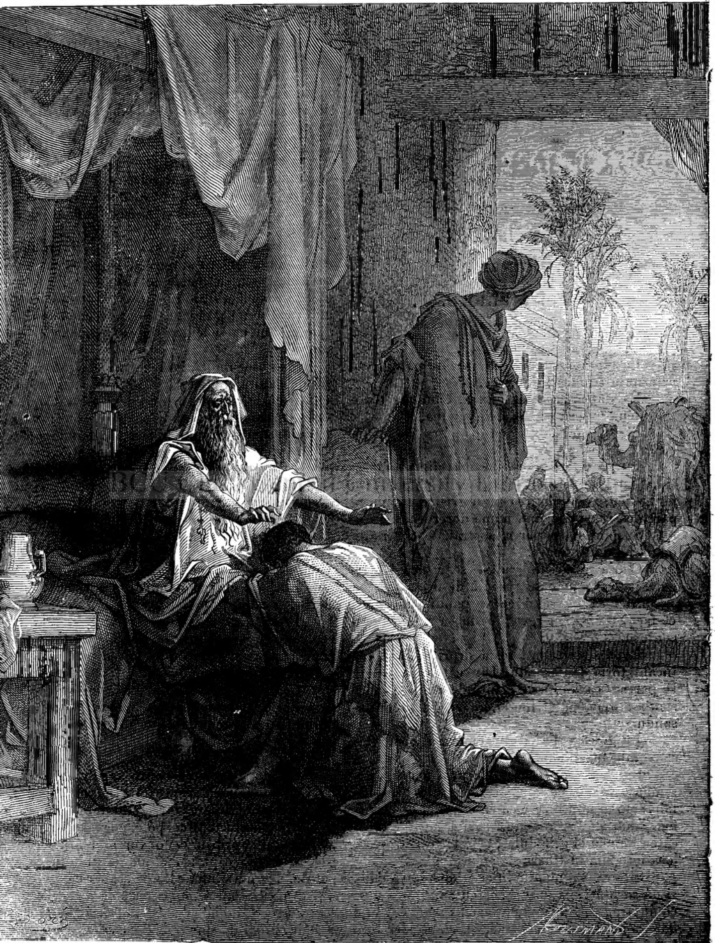
Isacu binecuventa pe Iacobu.