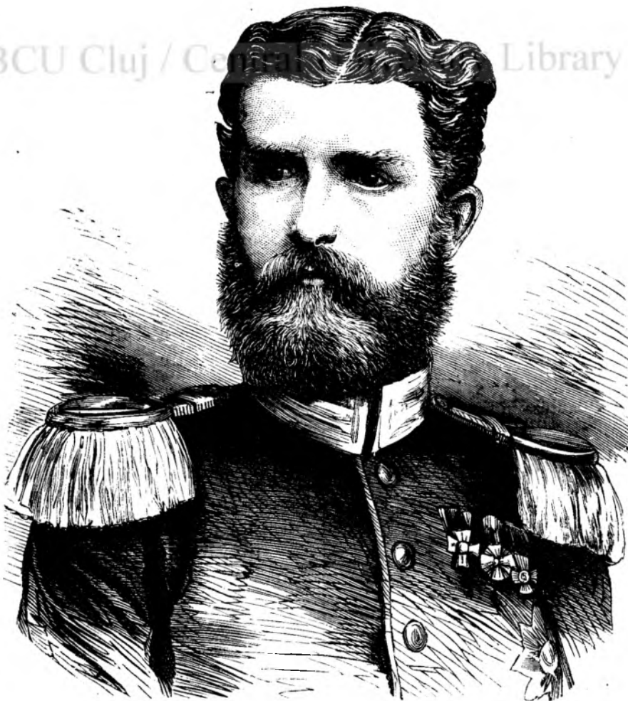
Leopoldu principe de Hohenzollern.

Astufelu deveni si barbatulu, a carui portretu se vede pe pagin'a