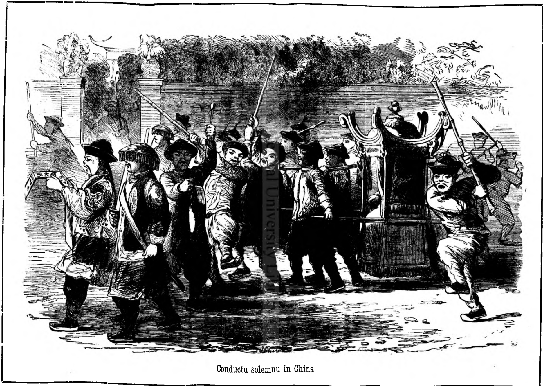
Conductu solemnu in China.