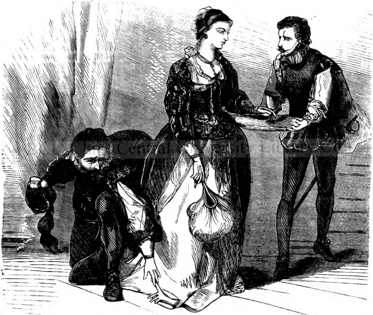
Unu barbatu se aplecà, aredicà manusi'a, si o ascunse iute in busunariulu seu. („Cavalerii nopti.“, pag. 116.)

Déca cine-va, in ultim'a dî a lunei lui septemvre in anulu 1735, ar fi mersu tardfu prin via felica in Roma, acel'a vedea intro casa vechiasi mica stralucindu inca obscur'a lumina prin tristele geamuri ale unei mansarde, pe-