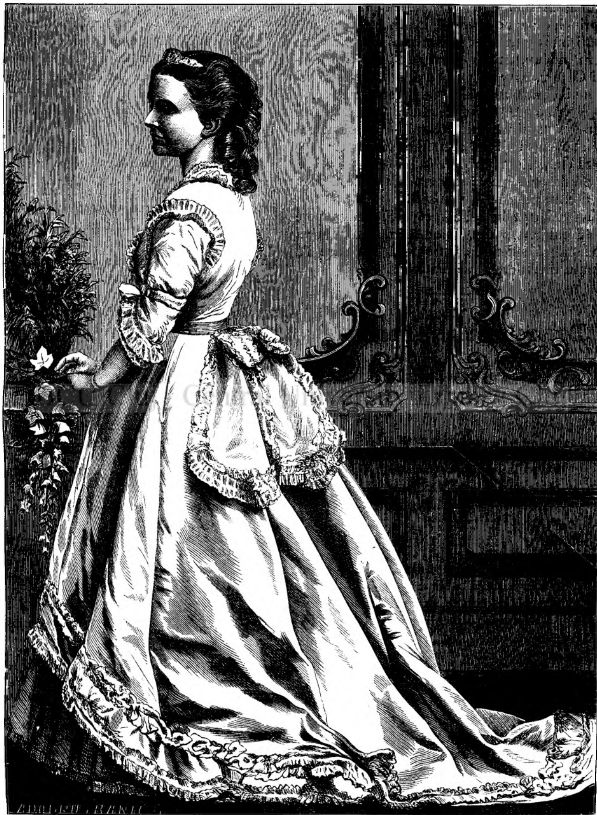
Principes'a Elisabet'a, Dómn'a Romaniloru.