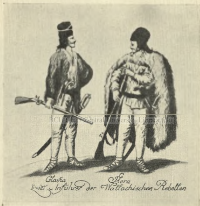
HORIA și CLOȘCA (Gravură contemporană)