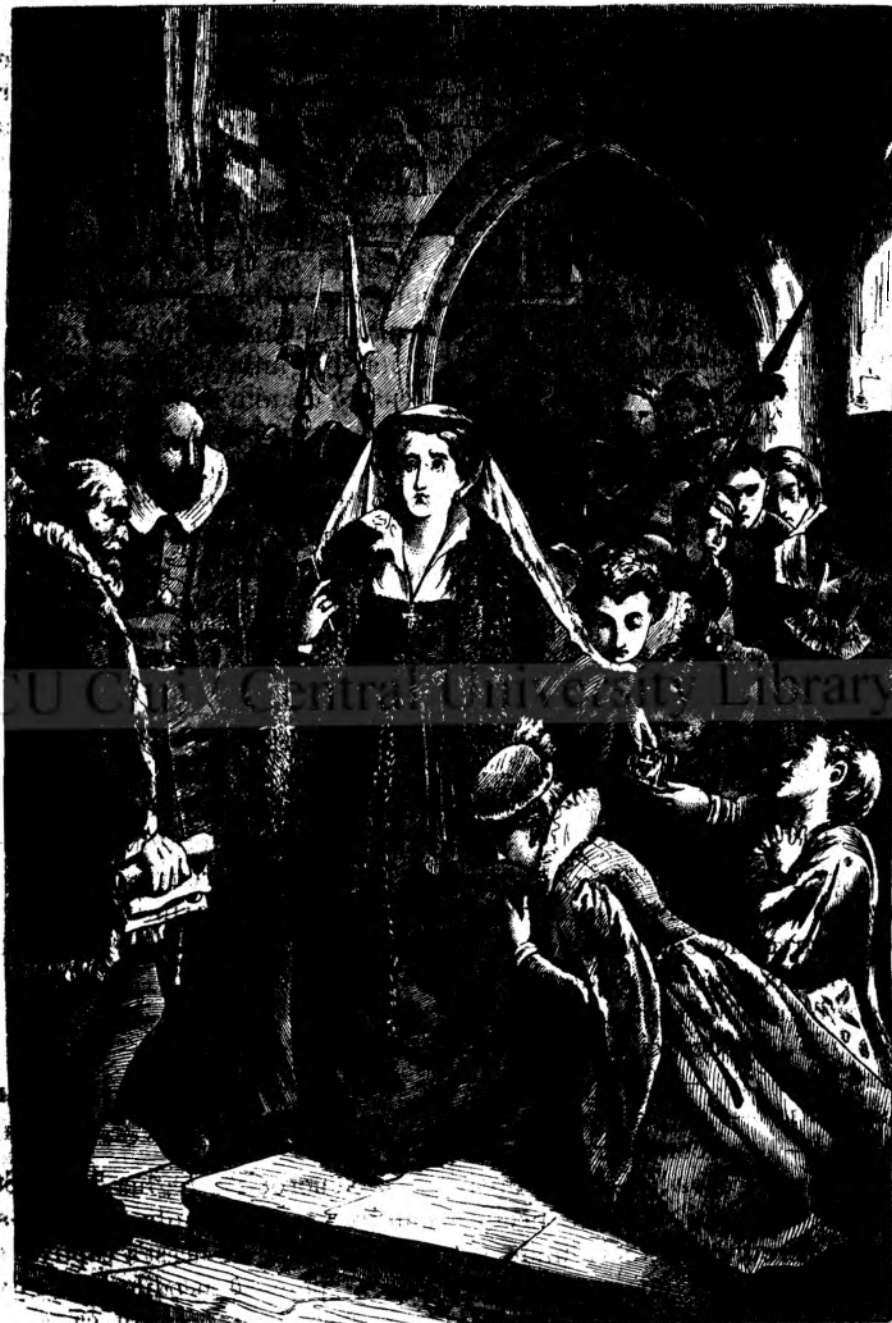
Maria Stuart pasiesce spre locul de pierdiare.

Individulu in cetate, caracterulu in arte nu se afla de cãtu de la crestinismu. Atunci