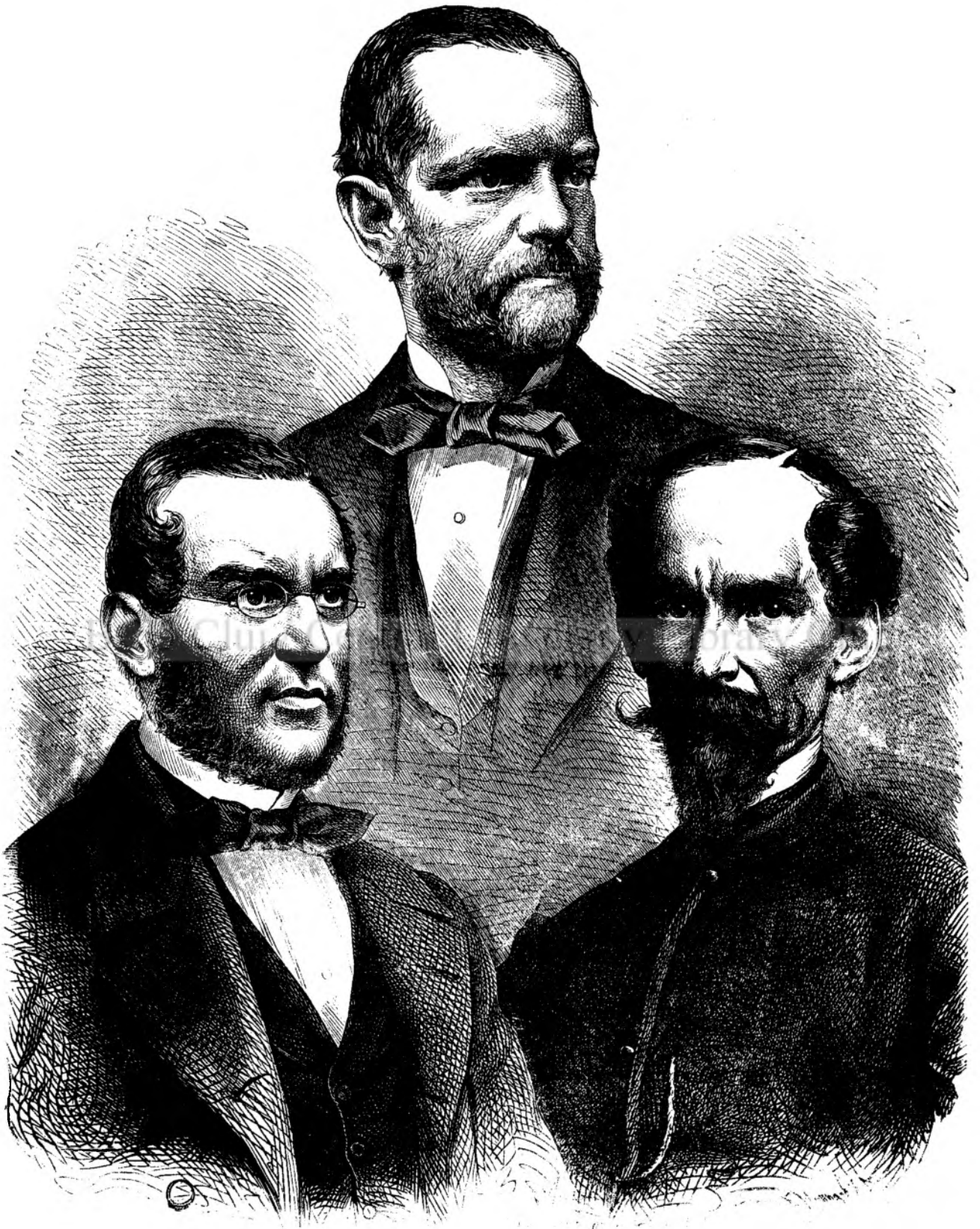
Trei barbati din Senatul imperialu.