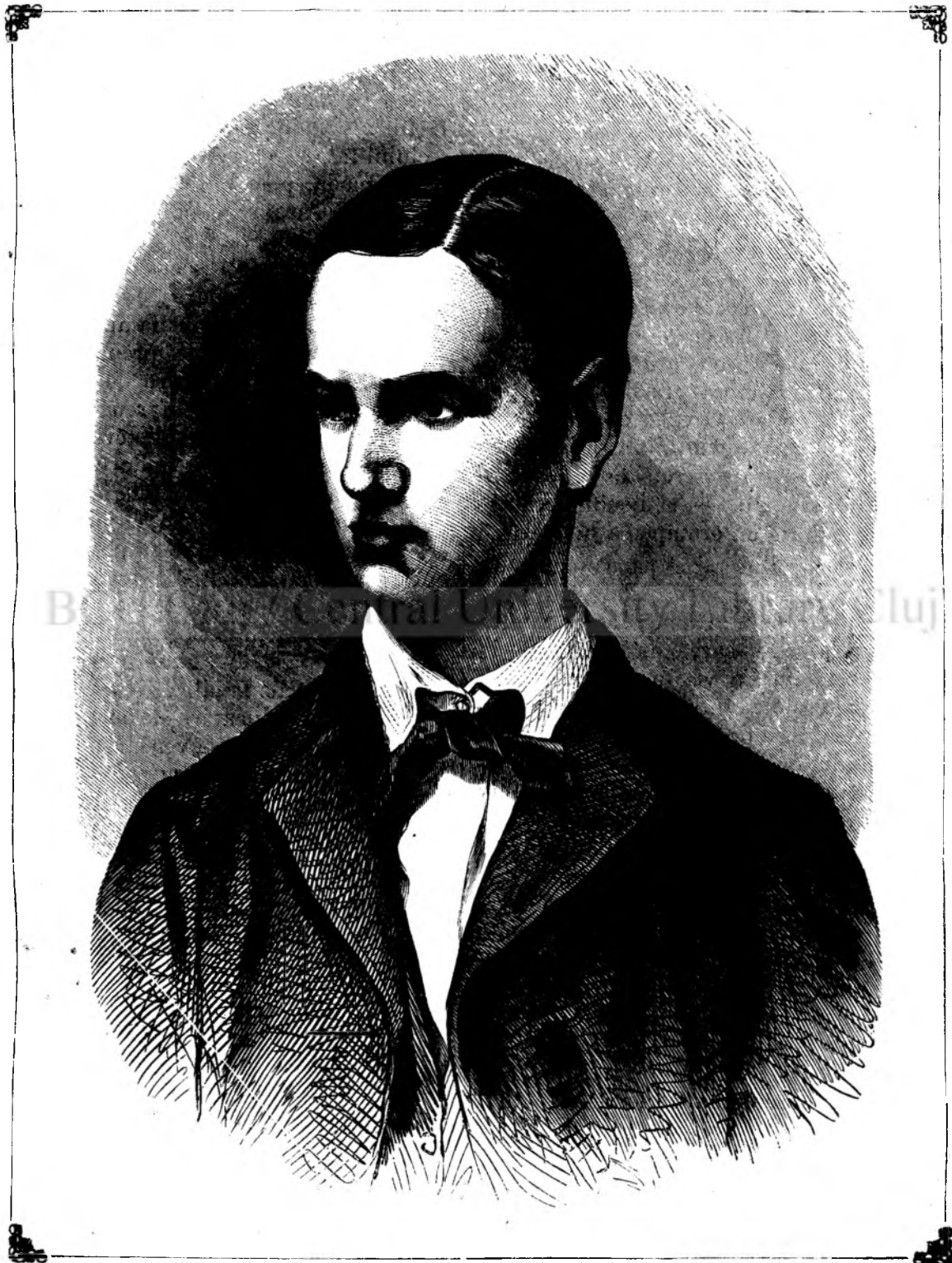
Georgiu I regele Greciei.

de voluntiri, si nâile Greciei i straportá neconținutu in faci'a locului. Grecia intréga, ti-pare unu arzenalu, unde se fabrica fara intrerumpere: puscii, arme, tunuri, nâi, se pregatescu cete