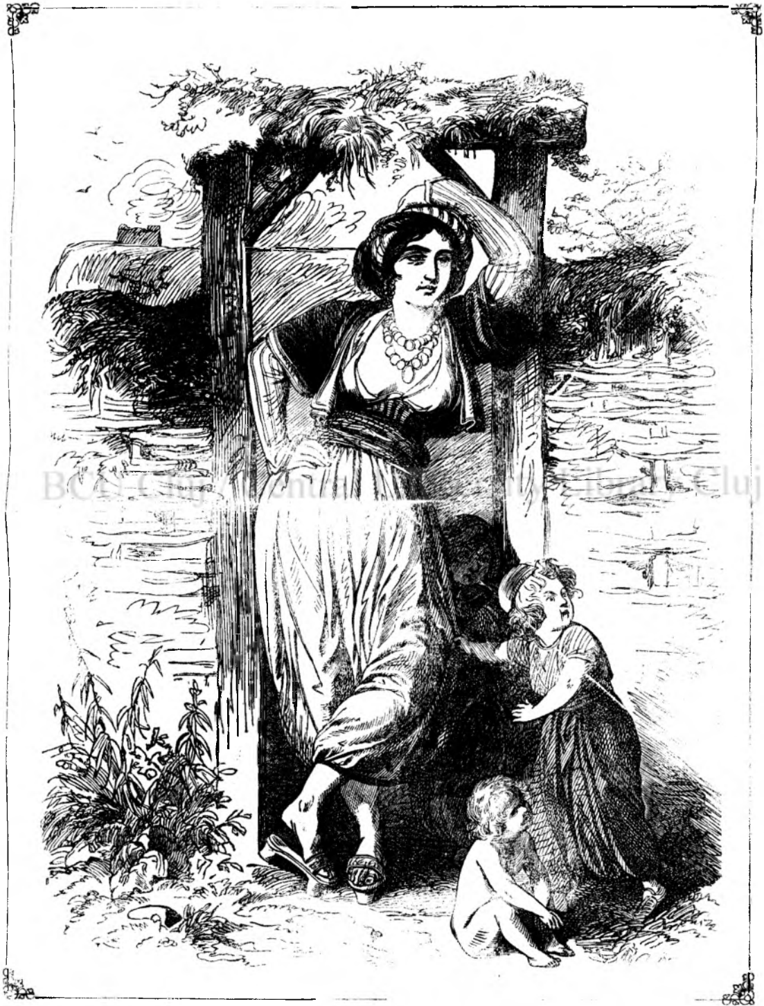
O crescina turca in Silistria (Vedi pag. 128.)

unu calugaru desperatu? Pote ti-pute innainte fumulu pulberelui de pusca si ti s'a coboritu curagiulu in tureci? Hei copilandre! cu astufeliu de curagiu nu se liberedia patri'a! Incai de ai bé, câ dora ti-ai mai capetá curagiu.