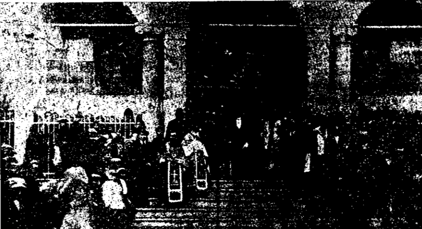
SFINȚIRIA BISERICII ROMĂNEȘTI DIN CORIȚA (ALBANIA)