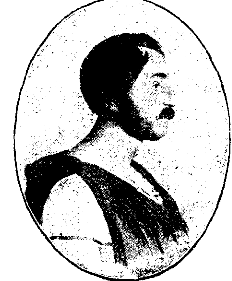
MIHAIL GRIGORE STURZA-VODĂ

REPREZENTANTUL GENERAL DIN ROMÂNIA: SOÓS & COMP, TÂRGU-MURĂȘ, (TRANSILVANIA) STR. PRINCIPESA MARIA 2. La comanda rugăm adresa exactă, județul și poșta vizuală.