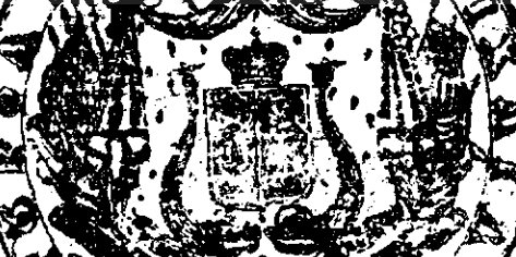
PECETEA LUI MIHAIL-STURZA-VODĂ