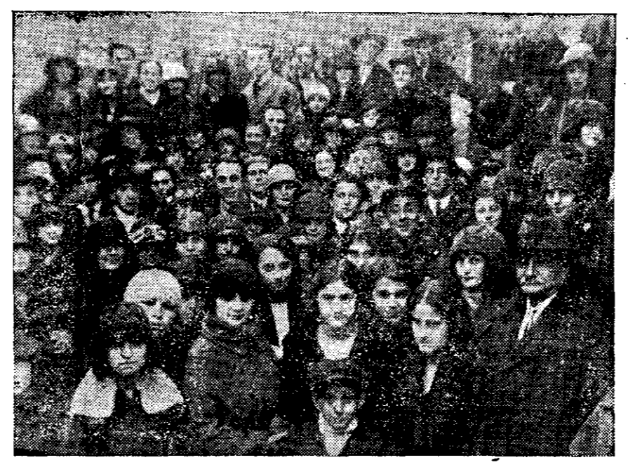
MEMBRI DIN SOCIETATEA CULTURALĂ „ZORILE” DIN BUCUREȘTI