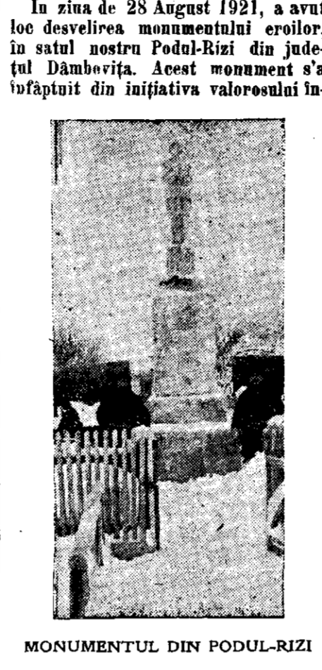
MONUMENTUL DIN PODUL-RIZI

In ziua de 28 August 1921, a avut loc desvelirea monumentului eroilor, în satul nostru Podul-Rizi din județul Dâmbovița. Acest monument s'a înălțat din inițiativa valoroșului în-