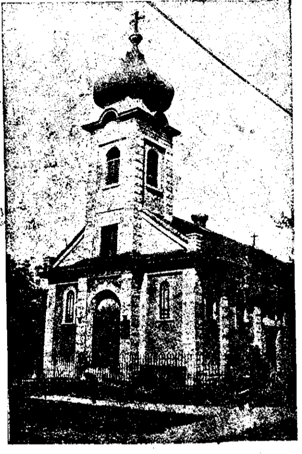
Biserica din St. Paul (Minnesota)