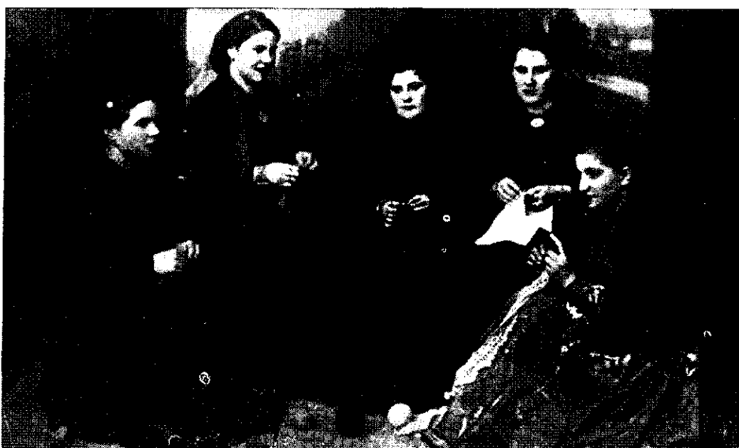
Fete macedonene din satul în care a trăit, a cântat și-a suferit „Ciobănița”