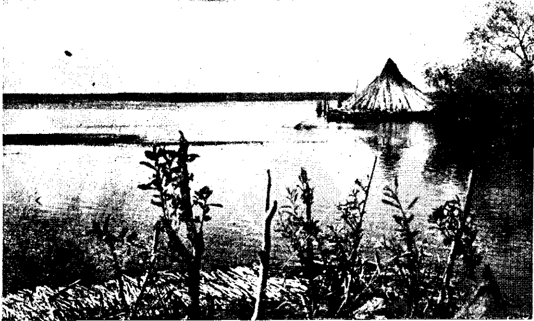
Pe unde pășteau oile sau creștea porumbul, acum sunt întinderi nesfârșite de apă: Dunărea s'a unit cu Borcea

Din gara Medjidia-Sud privesc cu mai multă atenție pe fereastra vagonului. Peisajul se arată și aci, ca și pe Băraganul meu, plin de farmec, dar cu totul deosebit. Văd în față, ca pe un ecran, toată întâișirea pământului dobrogean, ctreerat de mine în atâtea rânduri. Colțul acesta al României are într'adevăr o viață foarte ciudată. În