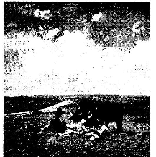
Pe pământul Dobrogei, lângă Valul lui Traian, Românul după ce și-a arat ogorul se odihnește mulțumit aproape de vitele lui

ni) mi-a răsărit în minte zilele trecute, după ce am venit în Capitală, de la o șezătoare literară și artistică organizată la Bazargic. Și gândul acesta nu mai mi-a dat răgaz până ce n'am luat acceleratul de Constanța din Gara de Nord și am plecat în Callaora, hotărât de data aceasta să-mi exercit, cu boată conștiințiozitate, profesia de observator și rob al scrisului.