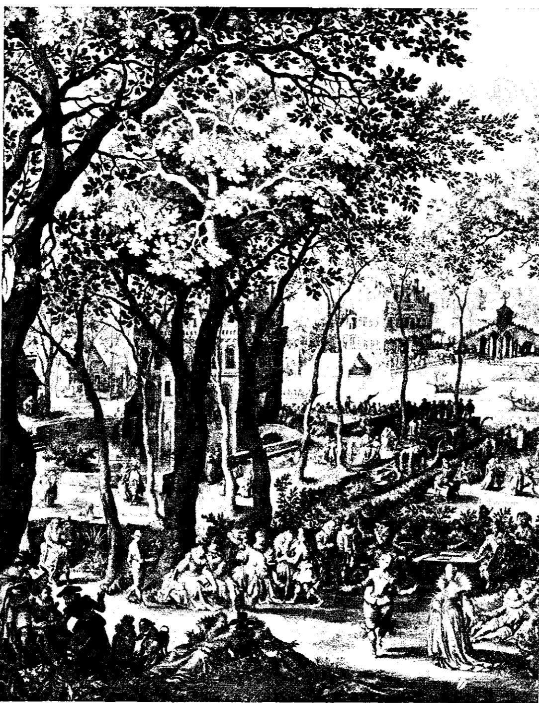
Nicolas de Bruyn: (sec. XVII).