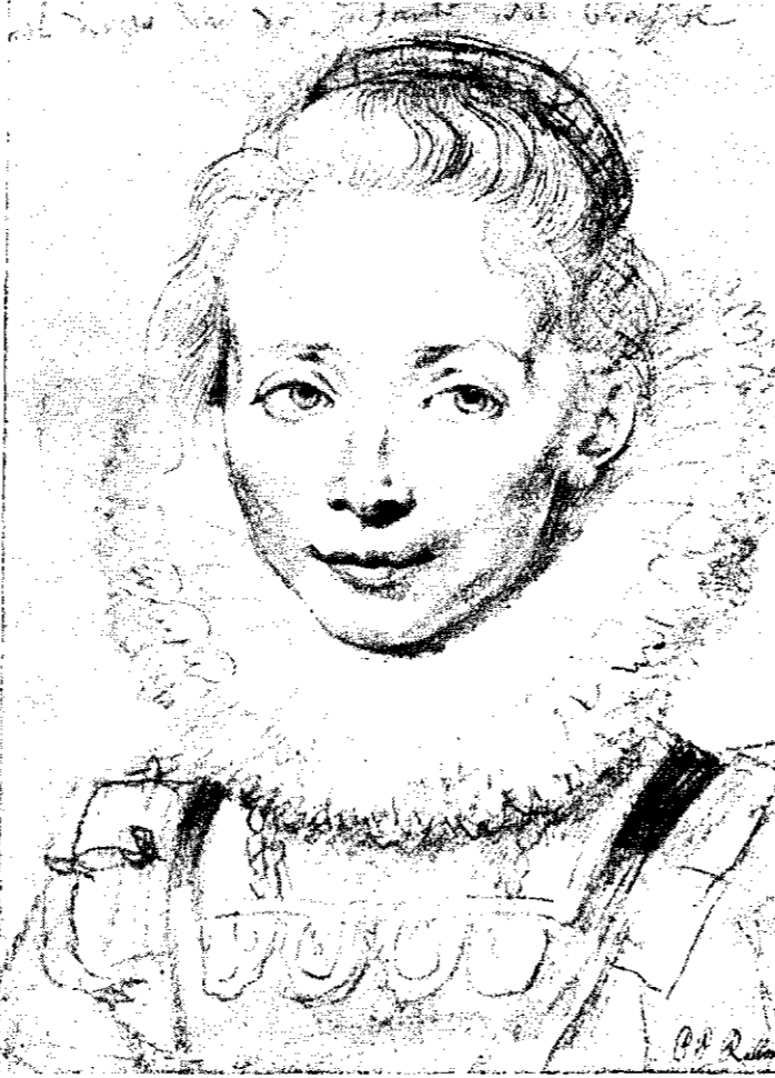
Peter Paul Rubens