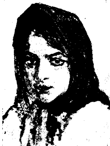
AP. MĂNCIULESCU: Țigancă

ca pe un poet în înțelesul strict al cuvântului, căci găsim în aceste lucrări o poezie subtilă și fermecătoare.