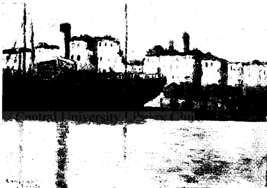
HENRY VINTILESCU: Constanța port

varietatea situațiilor și puternica plasticizare a realităților prinse sub penelul viguros și sigur al pictorului Steurer. E o expoziție bună care merită să fie văzută și să aibă succes.