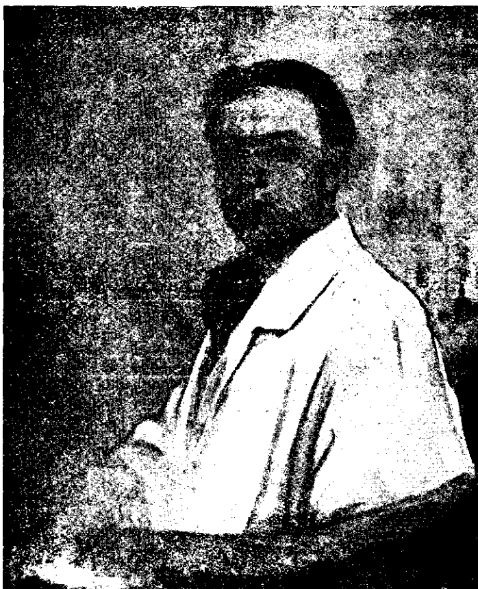
HONORIU CREȚULESCU; Portret