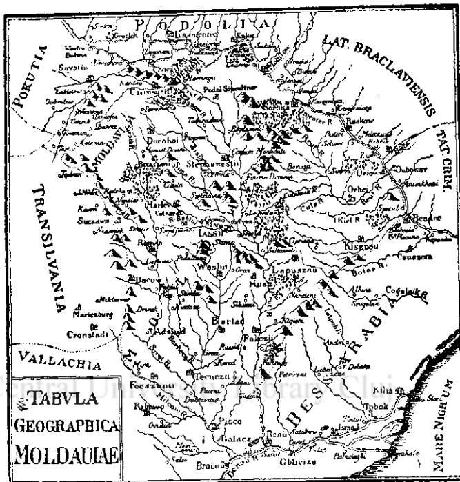
Harta Moldovei în timpul domniei lui D. Cantemir

Când bătrânul, cu ochii greoi de somn intră — alarmat — în odaie, îl găsi pe fiul său bolnav, adâncit în gânduri, cu coatele rezimate de genunchi, stând pe o grămadă de moloz.