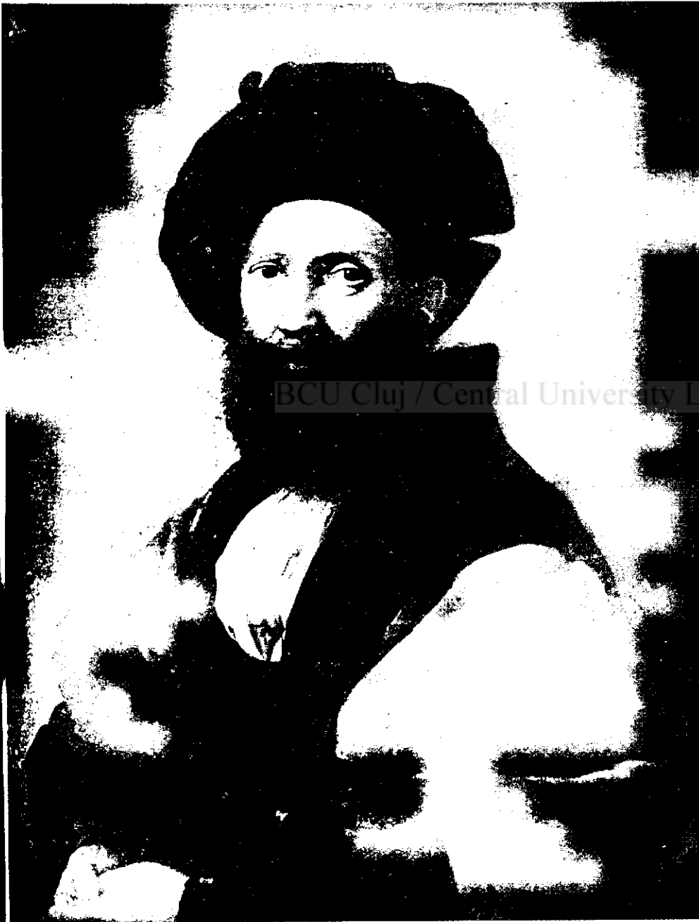
RAPHAEL: Baltazar, conte de Castiglione

acest portret a fost socotit 3000 franci. După moartea cardinalului ministru acest tablou a intrat, datorită lui Ludovic al XIV-lea în patrimoniul Franței.