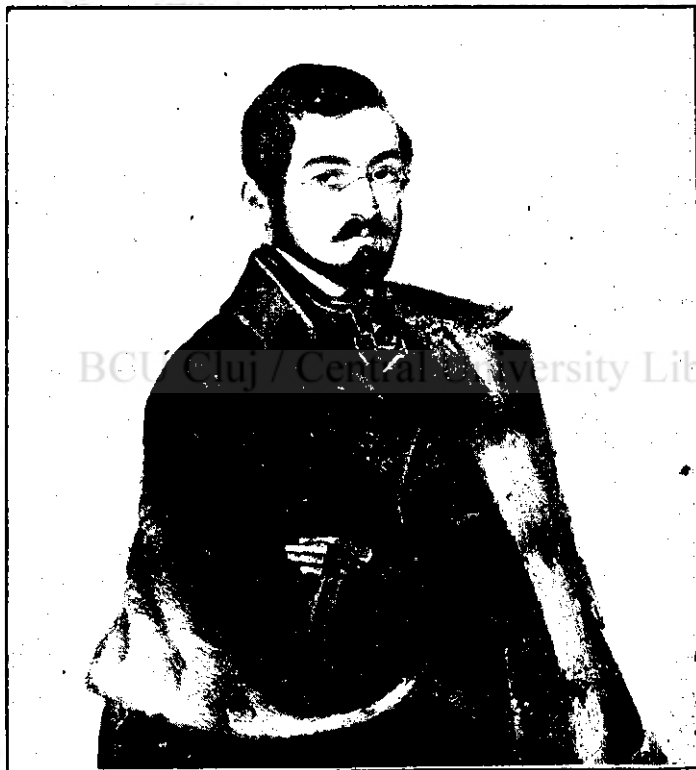
† M. KOGĂLNICEANU, student la Paris

Aceiaș naționalism temeinic, desătaț, constituie chiagul discursurilor Kogălniceanu. În Divanul ad-hoc din în Adunarea de acolo după alegerea Cuza, în Adunarea din București Unirea definitivă din 1861, și mai în chestiunea Improprietății țării și chestiunea independenței noastre, chestiunea Dunării pe la 1880, și Kogălniceanu sta totdeauna solid și neștergă în chestiunile noastre nesc și pe argumentele pe cari bine dovedite i le inspira. Din acea bogat românesc izvora căldura acesă și fraza oratorică, elegantă, și toare, care a slujit cele mai sfinte ale noastre în secolul trecut.